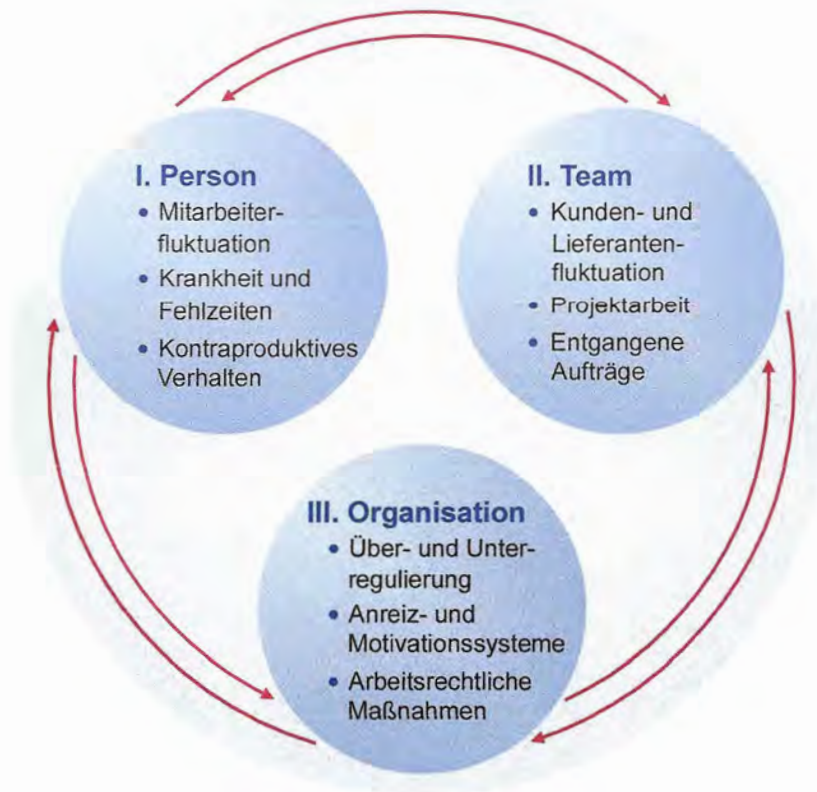
Konfliktkostenkategorien KPMG / Circle of Conflict

Als Antwort auf diese Frage wurde 2011 im Kreis der Unternehmerschaft Düsseldorf die Idee geboren, einen Erfahrungsaustausch zwischen Unternehmen zu initiieren, in dem Unternehmen gut gelöste Konflikte vorstellen und anschließend die entstandenen und ggf. auch ersparten Konfliktkosten transparent berechnet